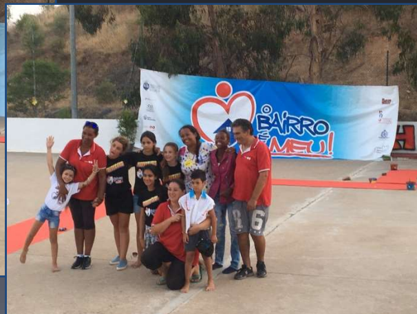
Da Caixa à Moda