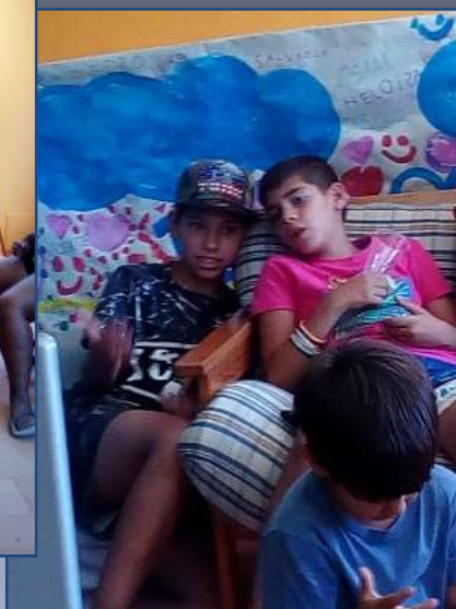
O Cinema do Bairro